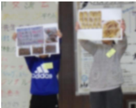
がっこうしょうかい 学校紹介

たいへいちゅう がっきゅう 太平中にじいろ学級のみなさん、ありがとうございました。