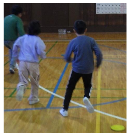
オセロひっくり返しゲーム