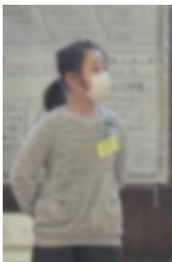
かんそうはっぴよう 感想発表