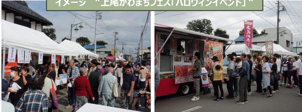
イメージ “上尾かわまちフェス「ハロウィンイベント」”