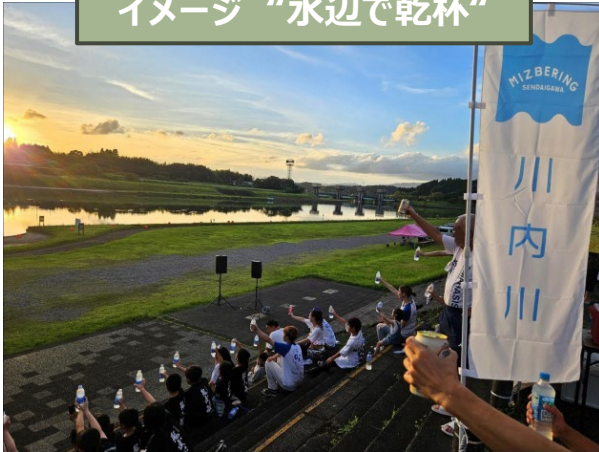
イメージ “水辺で乾杯”