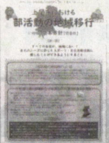
上尾市における部活動の地域移行に向けた基本方針(上尾市教育委員会中より)

行推進事業に関するリーフレットを作成し配布するなど、地域クラブ活動への理解を深めるための取り組みを進めています。