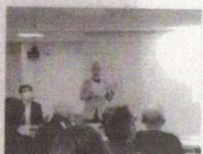
地域クラブ活動ミーティングでの発表

会においても本実証事業に協力し、令和5年9月から令和6年3月にかけて月に1回のペースで、市内中学校に所属する中学生等を対象とした「上尾市陸協中学生陸上競技教室」を開催し、参加生徒のニーズに合わせた指導方法の工夫や、適正な参加費額に関する考察等、課題の抽出に関する検証に取り組みてきました。