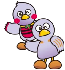
埼玉県マスコット さいたまっちょ&コバトン

※ 保育サービスは、6か月以上の未就学のお子さまに限ります。 無料、定員10名（申込順）