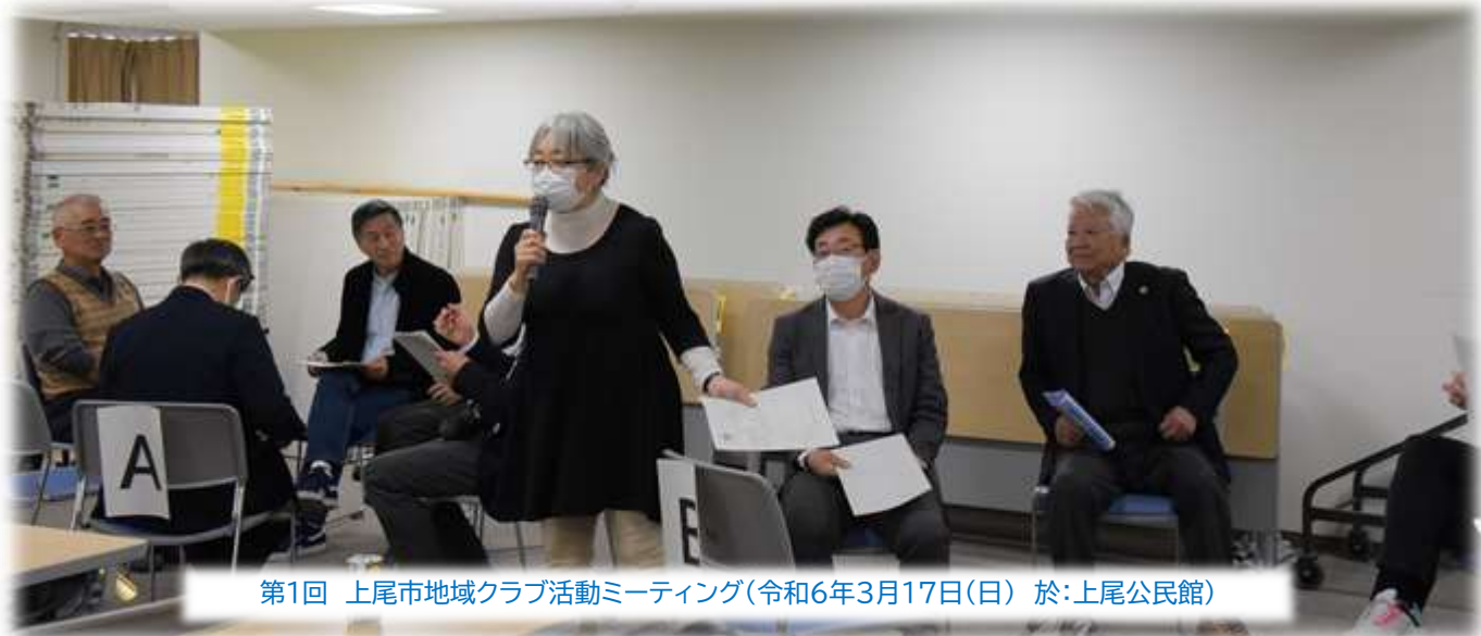
第1回 上尾市地域クラブ活動ミーティング(令和6年3月17日(日) 於:上尾公民館)