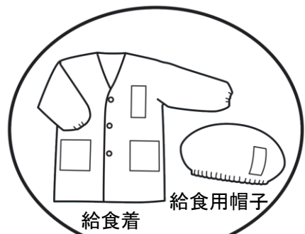
給食着 給食用帽子