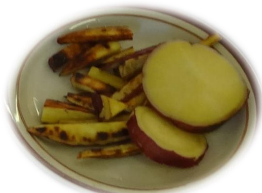
かりかり焼きと甘煮の完成！