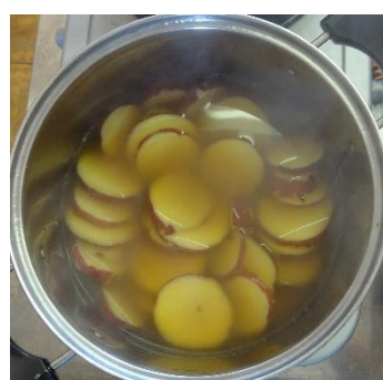
さとう ゆ い に 砂糖としょう油を入れて、煮る。