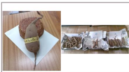
さつまいもの収穫 (しゅうかく) 11月6日月曜日

大が7こ、中が24こ、小が128こです。 大きいのがありました。うきうきしました。