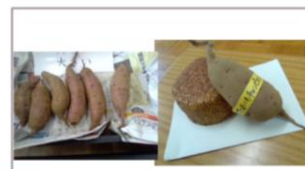
さつまいもの収穫 (しゅうかく) 11月6日月曜日

2023.R5 1% さつまいも しゅうかく 大 7こ } ぜんぶで 中 24こ } 159こ 小 128こ } さつまいもチャンピオン 380g