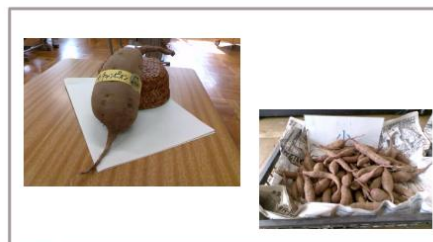
さつまいもの収穫 (しゅうかく) 11月6日月曜日

大7個、中24個、小128個でした。 全部で159個でした。 去年より少ないなと思いました。 収穫するときに、わくわくしながら取っていました。