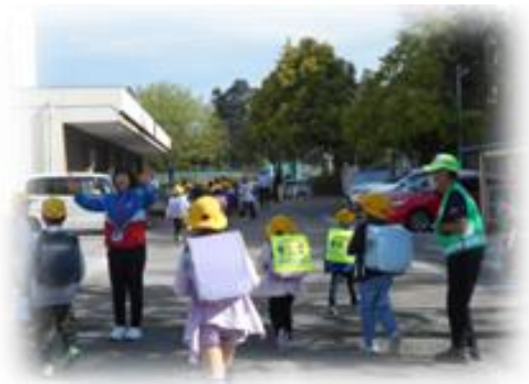
<朝の挨拶運動の様子>

本校学区は、毎日地域の方が通学路に立哨しての挨拶運動、4月当初は、青少年育成連合会平方地区の方による挨拶運動等、挨拶を通して、児童に人と人とのコミュニケーション力を身に付けるよう育成をしている地区であると痛感しています。私自身も、挨拶について今まで大切にしてきました。