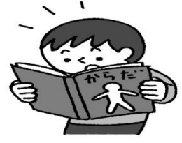
イ本について学びたいとき