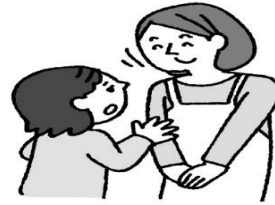
小歯みや心遣いがあるとき