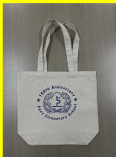
校章入りトートバック