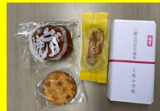
お菓子のセット(地元の老舗お菓子屋さんに発注しています)