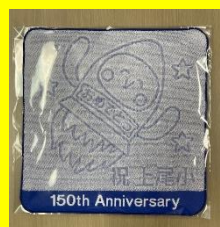
ハンドタオル (人文字メインデザイン)