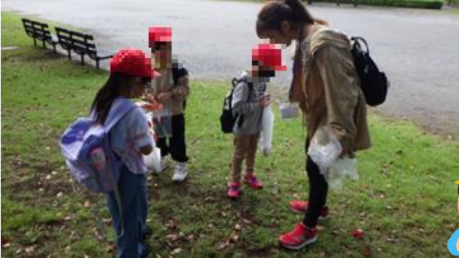
1 年生 生活科校外学習 (丸山公園)