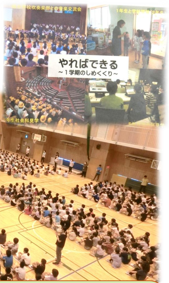
吉田校長先生のお話