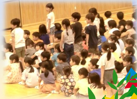
横山先生のお話 【7月の生活目標】

あいさつを元気にしましょう。 元気なあいさつをされると 嬉しい気持ちになります、 クラスの【あいさつ名人】を 3名ずつ発表していきます！