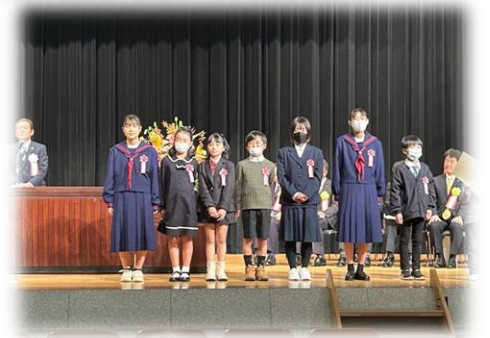
11月26日(日)に令和5年度上尾市青少年健全育成推進大会が上尾市文化センター大ホールで開かれました。エントランスでは、「家庭の日」ポスターコンクールに出品した作品が展示されていました。大谷中からの作品も沢山展示されていました。その中で、大谷中1年生から最優秀賞1名、優秀賞2名が入選し、ステージ上で表彰されました。