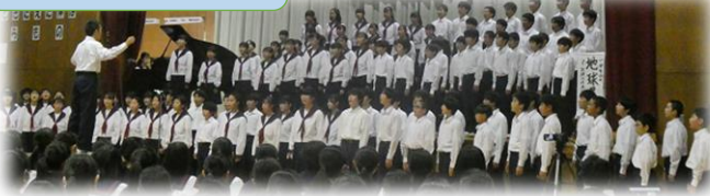
1年全体合唱 地球星歌～笑顔のために～