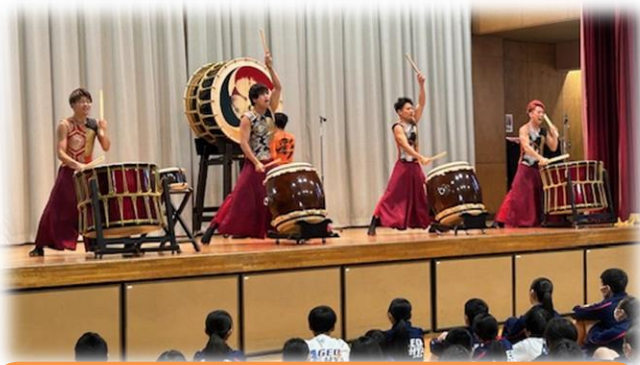
11月24日(金)、ふれあい講演会で「和太鼓グループ 彩-sai-」のみなさんをお招きしました。「夢・働く」をテーマに講演していただきました。激しい和太鼓のサウンドが体に響きわたりました。これからの進路を考えていく上で参考となるお話しもいただきました。