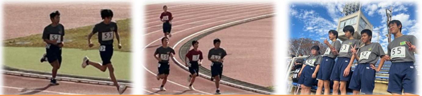
11月23日(木)、スポーツ&クラフト部が交流陸上大会に参加しました。短距離・長距離に参加し。大健闘してきました。