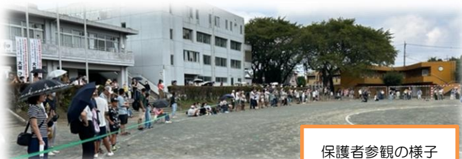
保護者参観の様子