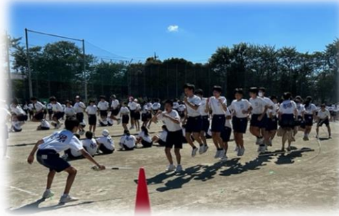
9月1日、体育祭練習が始まりました。全力で走り、整然とした整列。さすが大谷中生です。長縄の練習も始まりましたが、中々うまくいかず苦労しているようです。