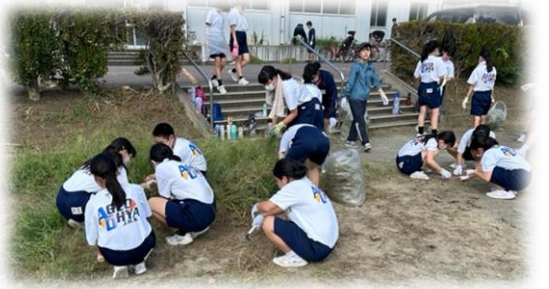
9月2日、PTA 除草作業が行われました。保護者・生徒・先生も一緒になって参加し、校庭を中心にきれいにしてくれました。気持ちよく体育祭を迎えることができました。