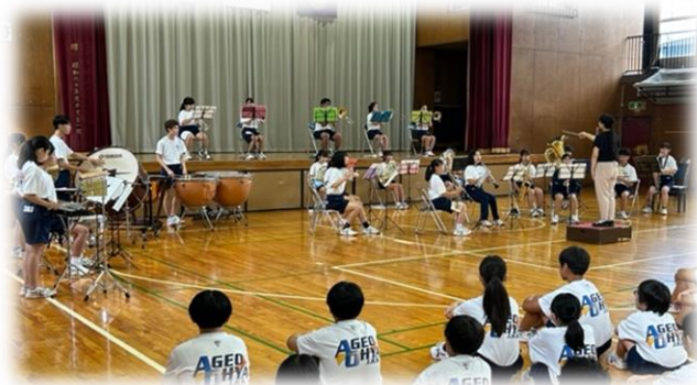
9月7日、生徒朝会で吹奏楽部のすばらしい演奏を聴くことができました。迫力あり心地よかったです。