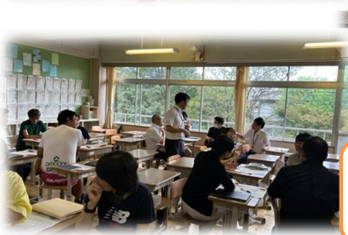
9月5日、講師の先生をお招きして、先生対象の道徳の研修会が行われました。先生も日々勉強です。