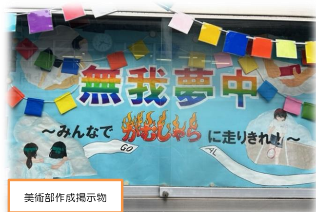
美術部作成掲示物