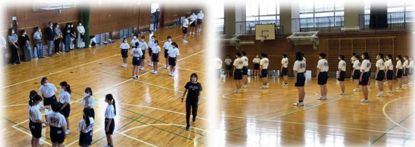
集団行動の基本を行っている体育の授業の様子です。左側は1年と3年の合同授業で3年生が1年生にアドバイスを送っていました。