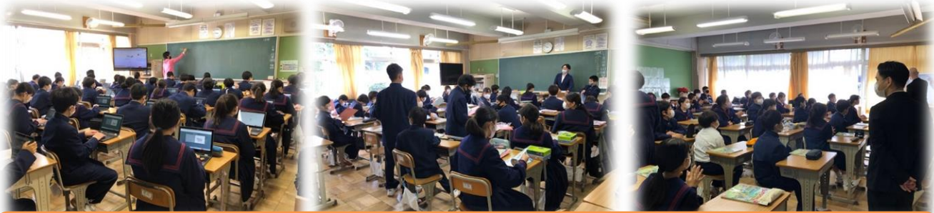
1年生各クラスの授業の様子です。理科の授業では早速タブレットを使っています。美術の授業では文字のレタリングに挑戦していました。英語ではALTの先生と一緒に学習していました。中学校の授業は色々な形で行われています。