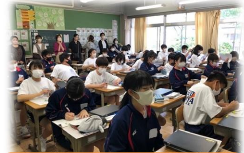
4/21 授業参観の様子です。話し合いではお互いに意欲的に発言をしてとても素晴らしいかったです。頑張り大谷中生！