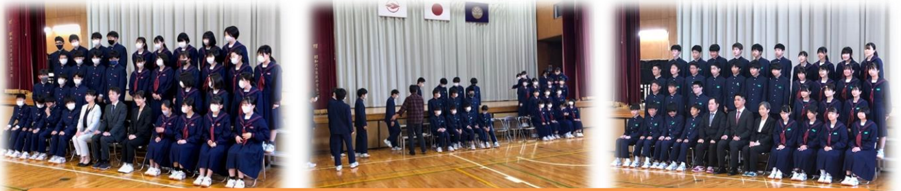
4/14 各クラスの集合写真を体育館で撮影しました。指先、足先まで神経を使って姿勢を整えていました。場面を考えて何をすべきかを考え、しっかり出来る様子はとても素晴らしいですね。