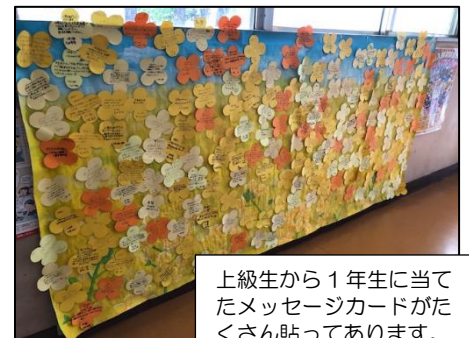
上級生から1年生に当たったメッセージカードがたくさん貼ってあります。

自分のペースで進めていくとよいと思います。雑で良い、適当で良いということではなく、頑張りすぎず肩の力を抜くことが必要なことなのです。また、ひとりで悩みを抱え込まずに、日頃から友達や担任の先生方、家族などの身近な人に相談するようにすると良いようです。放っておいて難しい状況になる前に、SOSサインを早めに出せると良いですね。