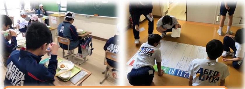
あおば学級の様子です。左は給食時間、右は誕生日や行事を一覧にした予定づくりにみんなで協力して作成しています。