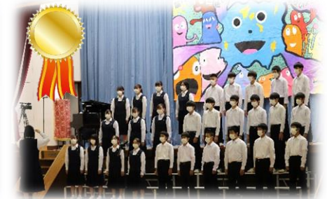
1年1組『あなたに会えて…』