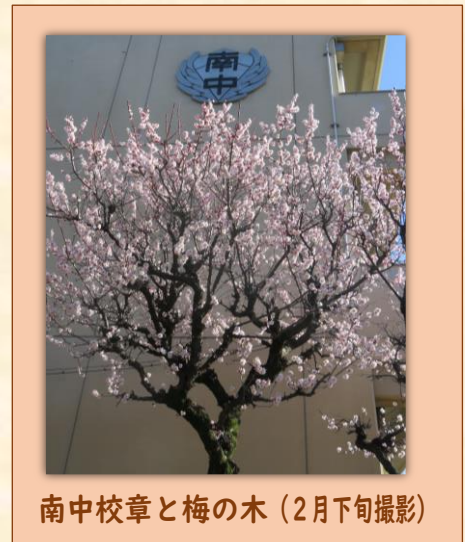
南中校章と梅の木 (2月下旬撮影)

いよいよ3月15日には、5年ぶりに卒業生、在校生、保護者、来賓を迎え、総勢約710名の卒業証書授与式を予定しております。卒業する3年生は南中を巣立つ集大成の姿を、在校生は祝福する姿を伝え合い、伝承できる場となる式を創り上げてまいります。また、3月26日をもって今年度の教育活動が修了となります。保護者の皆様、地域の皆様には、本校の教育活動にご理解とご協力を賜り心より感謝申し上げます。来年度も「チーム南中」として、子供たちが「社会を生き抜く力」の育成を皆様とともに行っていきたく思っております。今後ご支援ご協力をお願いいたします。