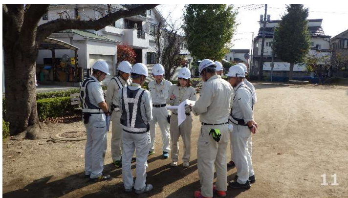
【指揮者による指示】