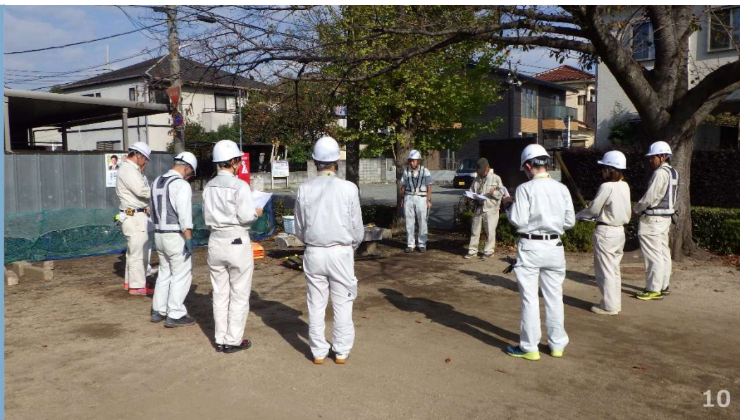
訓練開始 全体説明

交差点内での漏水事故を想定し、仕切弁の操作方法及び、管洗浄方法を習得するため、指揮者の指示に従い、作業を行うことができるか訓練を実施いたしました。引き続き、令和5年12月も管洗浄（実技）訓練を行い、令和6年1月には 認定試験（管洗浄実技） を予定しております。