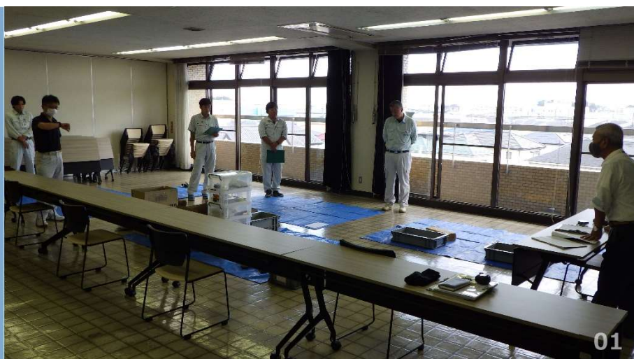
試験開始 全体説明

給水装置工事事業者への的確な指示を行うこと及び、緊急時には自ら応急復旧を行うことも想定し、令和5年9月14日（木）、21日（木）にHIVP管の接合訓練を実施しました。さらに、訓練の成果を図るため、令和5年10月2日（月）、5日（木）、12日（木）に 認定試験（HIVPの接合） を実施しました。訓練内容に応じて認定試験を実施することで、作業工程を振り返り、実動班員の更なる技術力の定着・向上が見込め、水道に関するエキスパートの育成を目指しております。