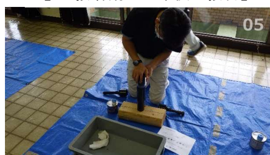
【4. 接着剤の塗布後の接合】