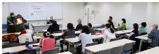
▲紙芝居に見入る参加者