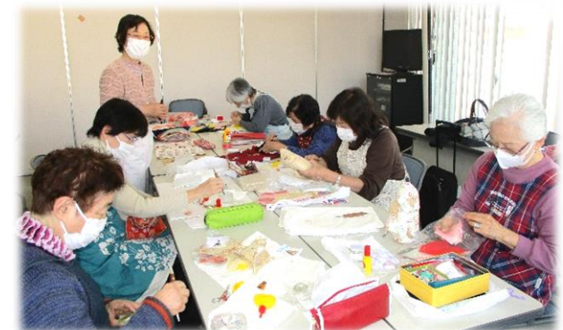
▲心を込めて作ります

木目込み人形の会 では、人形作りを通して親睦を深めながら、伝統文化を継承し、作品を施設に展示するなど、今後もものづくりの楽しさを伝えていきたいと考えています。