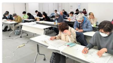
▲熱心に耳を傾ける参加者