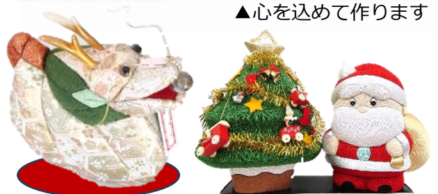
▲干支やサンタなど季節に合わせた木目込みも！