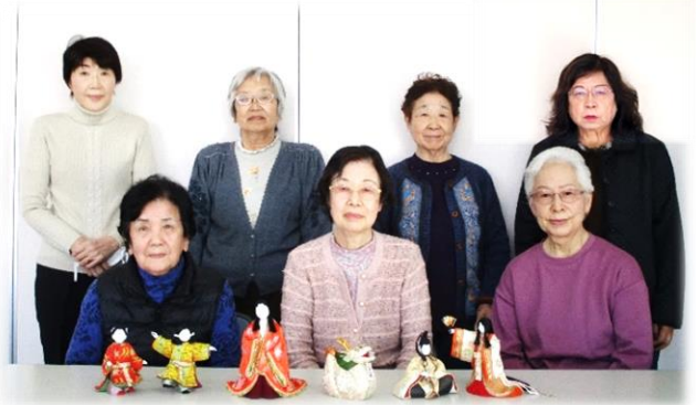
▲木目込み人形の会のみなさん