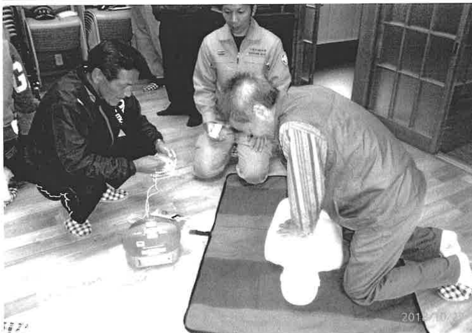
AED使用訓練 平成30年 10月27日