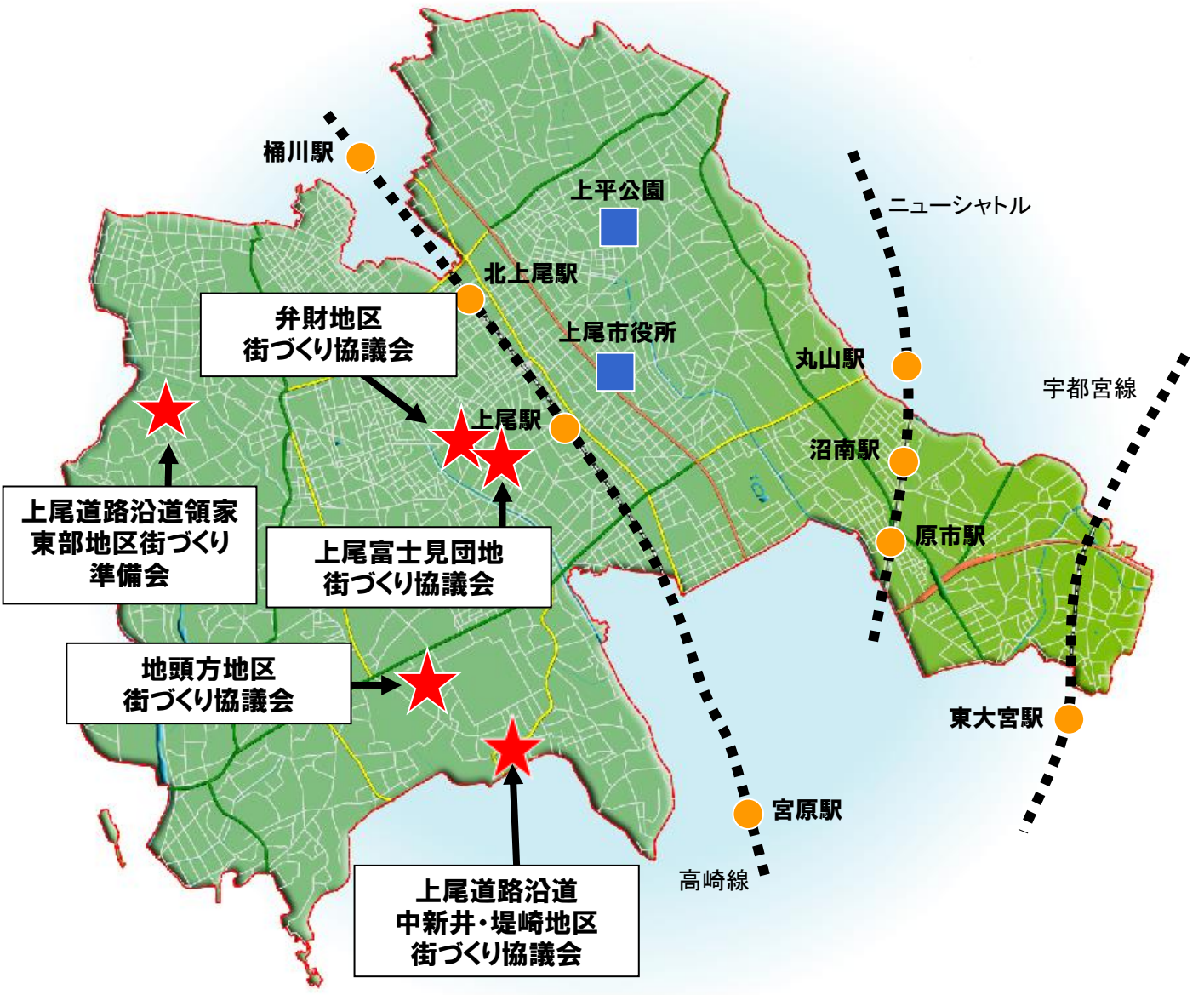
街づくり協議会位置図