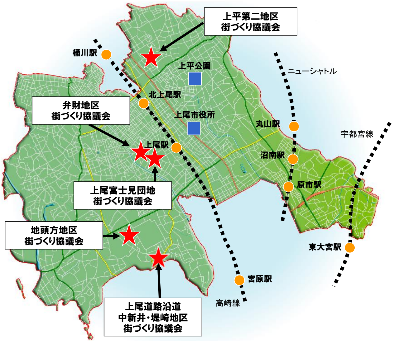
街づくり協議会位置図