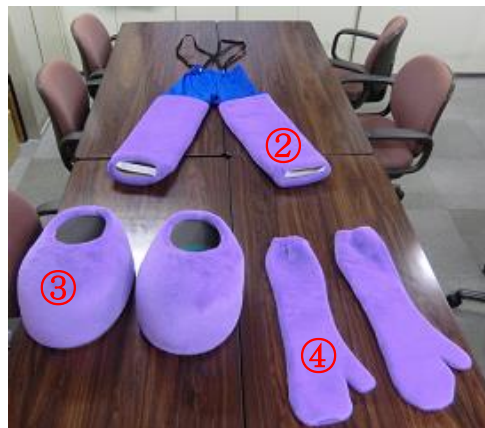
① 本体 ②足（つなぎ） ③足（靴） ④手