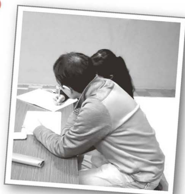
テストに向けて勉強しています。

「でんでん虫」で食事があわったら、学習支援サークル「あたまじゃくし」で、スタッフに教えてもらいながら、宿題や勉強もしています。家に1人有的时候には宿題をなかなかやる気になれなかった子ども、ここで勉強するようになって、100点とれたよ！と報告してくれることも。うれしい瞬間です。子どもが自立していくためには、子ども自身が力をつけていくことも必要だと考えています。子どもだけでなく、お母さんからの悩みをスタッフが聞くこともあります。親子の成長を見守る居場所であり、子どもたちにとっては調理や学習をすることで生きていく力をつける助けになることを望んで活動しています。