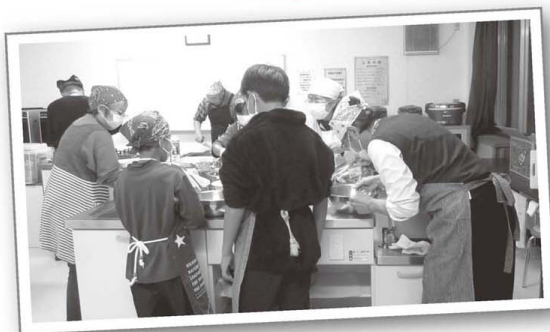
みんなで調理している所