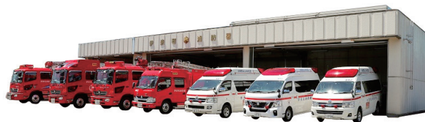
上尾市東消防署伊奈分署(現伊奈町消防本部)

高齢化社会に伴う救急件数の増加、複雑・多様化するあらゆる災害に対応するため、消防本部の規模の拡大により消防体制の整備・強化、効率的な人員配置・財政運用を目的として行うものです。