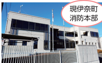
現伊奈町 消防本部