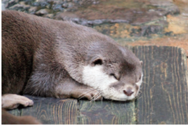
コツメカワウソのナナ