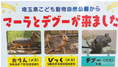
マーラとデグーの看板

動物は警戒心が強く、体調が悪い時でもそれを意図的に隠してしまうのだと言います。そ