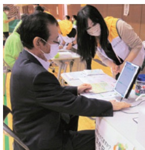
野菜摂取レベルを測定

また、10月9日(日)には、上尾運動公園で「市民体育祭」が開催されます。体育祭コーナーの他、今