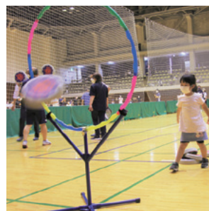
円盤を投げて競うアキュラシー

回、新たにボルダリングをはじめ、ノルディックウォーキングやアキュラシーなどの体験コーナーを設けています。お子さまとも一緒に楽しむことができますので、一緒に汗を流してみませんか。当日は体脂肪の測定や健康相談も実施しておりますので、ご自身の体の状態を把握してみましょう。