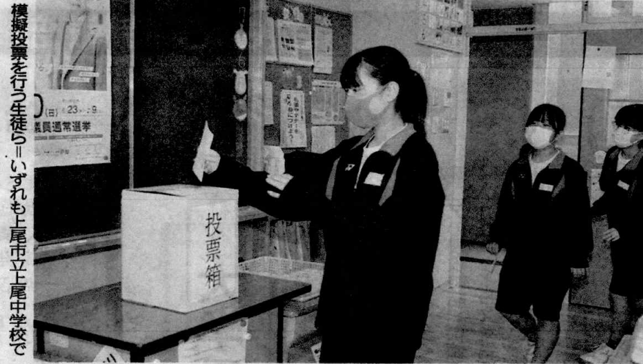
模擬投票を行う生徒ら。いずれも上尾市立上尾中学校で