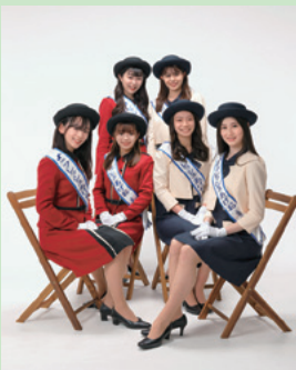
6人で上尾の魅力を発信！ キラリ☆あげおPR大使 2022フレッシュあげお(P.17)