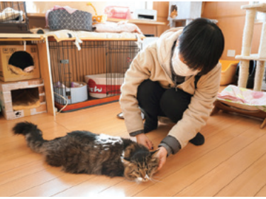
猫を世話するボランティア

私がアニマルエイドを訪れ て感じたのは、スタッフの皆 さんが猫への思いやりにあふ れているということです。し かし、思いやりだけではどう にもならない現実がありまし た。猫を施設に受け入れると いうことはそれだけ費用がか かるということです。また、 現在シェルターにいる猫の健 康や衛生を保つためにも、む やみにたくさん猫を引き取