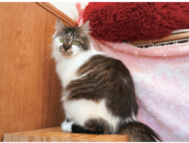
施設で暮らす保護猫

ることはできません。猫を引 き取ってほしいという連絡に も、このような事情からすぐ に対応できない場合があるそ うです。行き場をなくした猫 を全て助けられないことに、 皆さんも心を痛めていました。 そもそも、行き場をなくす 猫をこれ以上増やさないため にはどうすればいいのでしょ うか。今回お話を聞いて2つ の大切なことを学んできました。 1つ目は猫を飼う際に、 飼った猫を最後まで見届けれ る状況にあるかを考えるとい うことです。近年、高齢の 飼い主が亡くなったり、福祉 施設へ入所したりして、飼い 猫が居場所を失ってしまうこ とが増えているそうです。そ