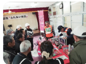
上尾市防災士協議会による防災講座