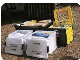
避難所開設キット

「自分たちの地域は自分たちで守る」という連帯感に基づき、地域の人々が自発的に、防災知識の普及啓発、避難所運営、初期消火活動などの防災活動を行う組織です。