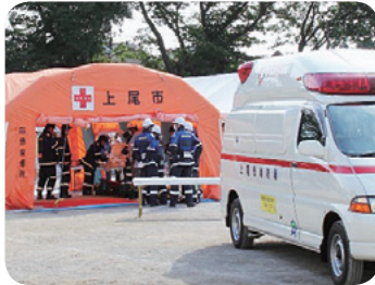
各団体と連携した訓練

市では、上尾市医師会、上尾伊奈地域薬剤師会、埼玉県北足立歯科医師会と協定を締結しており、災害時における医療救護などに関する体制の構築を図っています。