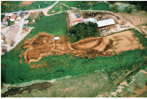
(左) 方形周溝墓群、(右) 殿山古墳 [昭和52(1977)年の発掘調査] ※古墳は私有地のため、立ち入り禁止です。

コロナ禍の悩ましさが尾を引きます。2度目の東京オリンピック・パラリンピックが緊急事態宣言下で開催されました。 今日も今日とて、プレフレイル渦中の銀輪散歩ですが、些か飽きてきたところで、幾度となく、畔吉地域に出掛けます。目指すは、榎本牧場や殿山聖地墓苑。そこには、上尾市内で唯一、人知れず残された殿山古墳があります。目的は、古墳に生えているカシヤコナラの大樹の観察です。理由があります。つい