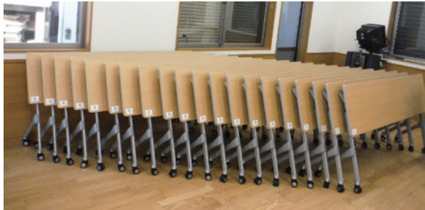
原市五区町内会に整備した集会所備品