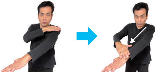
左腕を右手でなで下ろす

日常生活で使える手話を一緒に学びませんか。市ホームページでは手話動画を公開中です。今月は「上手・うまい」を紹介します。