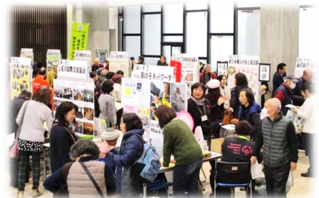
【ホワイエで市民活動団体等のパネル展示】

ホワイエでのパネル展では、熱心に説明や参加方法を聞く人や、ブースを回って資料を集める人で大いにぎわいました。参加した活動団体の会員さんは、「たくさんの方が関心を寄せてブースを訪れてくれました。何人入会してくれるか楽しみです」と笑顔で話しました。