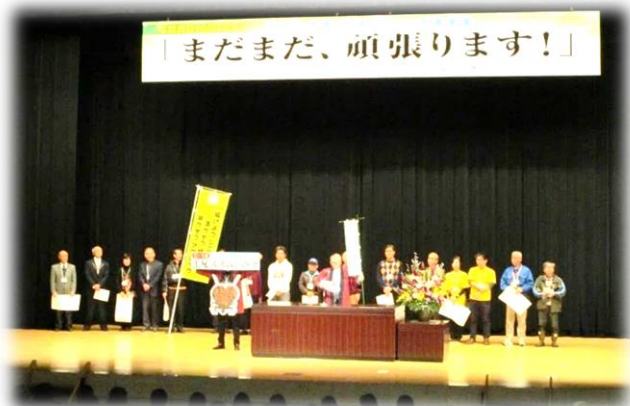
【第1部 ステージで団体の活動紹介】

第1部はステージでの市民活動団体の紹介。市内市民活動団体、社会福祉協議会、シルバー人材センターなど26の団体が参加しました。各団体の持ち時間は1分。団体名を書いた大きな紙を掲げて活動紹介をしました。メッセージが短く簡潔でわかりやすかったと、参加者から好評でした。