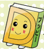
あっぴいぶっくるのキャラクター「アッピー」

子どもの読書活動支援センター 【開館時間】 10:00～16:30 所 柏座4-3-8富士見小学校内 電話・ファクス 773-3711