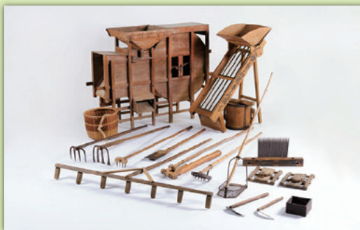
「上尾の摘田・畑作用具」の一部