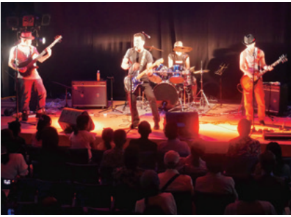
—昨年のAGEBUNサマーライブ