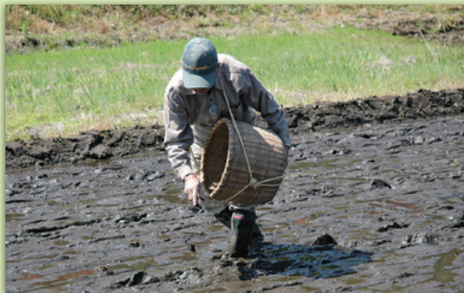
いっごししょう 一斗五升ザルで種籾をまく田摘み(播種)

1月15日、国の文化審議会が市が所有する「上尾の摘田・畑作用具」を、国重要有形民俗文化財に指定するよう、文部科学大臣へ答申がなされました。市で初の国指定文化財となることを記念して、この文化財の魅力と上尾市の農業の歴史を紹介するパネル展を開催します。時 3月8日(月)〜17日(水)10〜17時(17日は12時まで) 所 市役所ギャラリー 内 「上尾の摘田・畑作用具」を解説するパネルの展示、再現映像「上尾の摘田」の放映