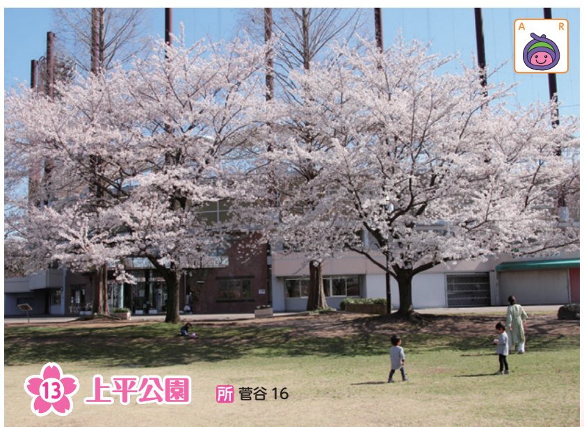
13 上平公園 所 菅谷 16

時とき 所ところ 内内容 対対象 甲申し込み ※記載のないものは「当日、直接会場へ」