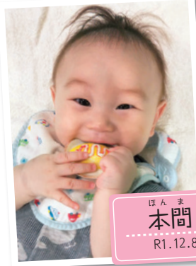
ほんま そう 本間 想くん R1.12.8生 (1歳)