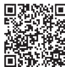
国税庁 ホームページ

【勤務期間】令和3年1～3月 【勤務時間】8時45分～17時30分の間で、4～7時間 所上 尾税務署 【勤務内容】確定申告事務の補助作業①データ