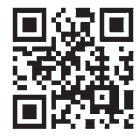
恋たまホームページ

県への移住を考えている③電話回線のあるスマートフォンを所持している 費 市内に住ままたは勤務先が会員の人1万1千円(2年間有効) ※詳しくは、恋たまホームページをご覧ください。 国 県少子政策課 回 830-3343 電 830-4784