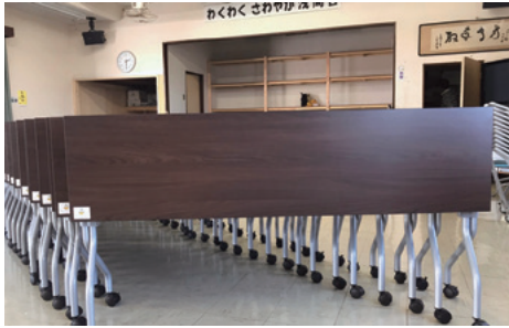
浅間台自治会に整備した集会所備品

収入を財源に、コミュニティ助成事業を実施しています。令和2年度コミュニティ助成事業の一環として、次の物を整備しました。浅間台自治会／集会所備品(テーブル、椅子など) 〇市民協働推進課 〇775-4539・〇775-0000