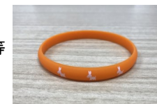
認知症サポーター養成講座受講者にお渡しする「オレンジリング」

URL: http://www.pref.saitama.lg.jp/a0609/kyaravan/supporterindex.html