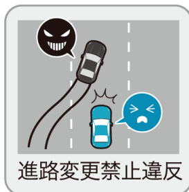
進路変更禁止違反