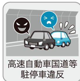
高速自動車国道等 駐停車違反