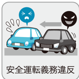
安全運転義務違反