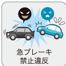
急ブレーキ 禁止違反