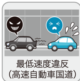
最低速度違反 (高速自動車国道)