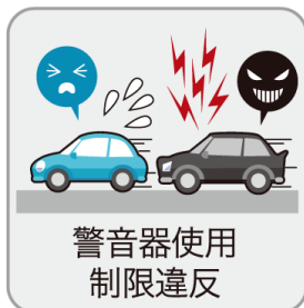
警音器使用 制限違反