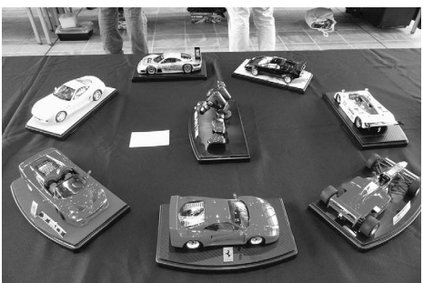
昨年のあげおプラモ展 展覧作品

6月7日(日)に文化センターで開催する「あげおプラモ展」で展示するプラモデルなどの模型作品を募集します。①