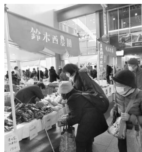
多くの農産物が並ぶ「あげお朝市」

市内で生産した農産物を農家が直接販売します。新鮮で安全な野菜、季節の花や果実、飲むヨーグルト、手作りまんじゅう(4～6月だけの販売)など数多く取りそろえています。 ① 朝市/毎月第4(土)9時30分～12時 ※ 8月だけ第