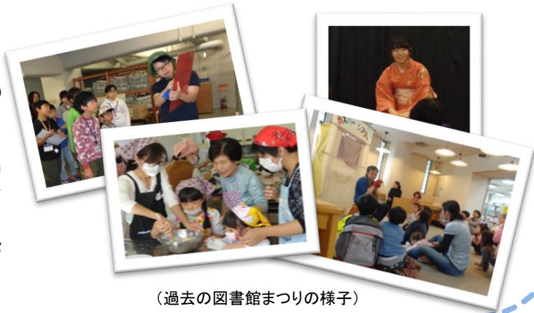
(過去の図書館まつりの様子)