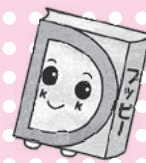
あっぴいぶっくるのキャラクター「アッピー」

乳幼児・小学生の皆さん、イベントに参加するときは「読書パスポート」「えほんのきろく」を持ってきてね！スタンプを押すよ！