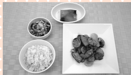
もち麦ごはん、鶏むね肉と野菜の甘酢あん、ミックスビーンズとツナのサラダ、ピンクフルーツかんてん