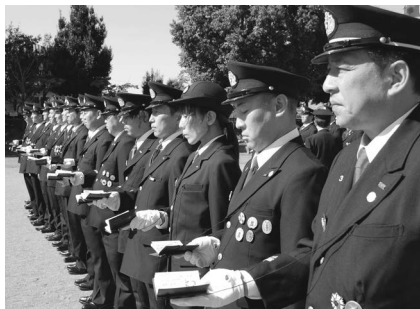
昨年の消防特別点検