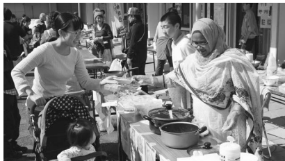
昨年の多文化交流フェアの様子

時 とき 所 ところ 園 内容 対 対象 費用・金額 ※記載のないものは「無料」 定 定員 持 持ち物 申 申し込み ※記載のないものは「当日、直接会場へ」 問 問い合わせ