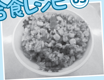
コーンピラフ 344キロロ