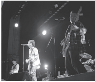
さまざまなジャンルのアーティストが出演

時7月20日(土)10時30分〜17時 所文化センター 内音楽バンドや弾き語りによるポップス・フォーク・ロックなどの市民参加型音楽ライブ【出演】一般公募で集まった市民アーティスト16組程度 定150人(先着順) 内文化センター 774-2951・774-2955