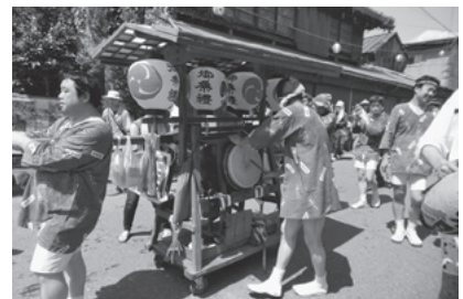
武州平方箕輪囃子連のタカウマでの演奏