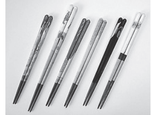
オリジナル「マイ箸」

プロ野球の試合で折れたバットを再利用して、自分の手のサイズに合わせた、世界で一つのオリジナル「マイ箸」を作ってみませんか。併せて箸の歴史や文化、正しい箸の持ち方、食文化や食事マナーを学びましょう。☎7月21日(日)13時30分～(2時間30分程度) 所 コミュニティセンター 市内に在住の年長児～小学生と保護者 ※箸の製作は子どもだけです。費 1,780円(1人1,620円、1家族3人分まで送料160円) 定 20組(応募者多数の場合は抽選) ※保護者1人につき子ども2人まで参加できます。申 往復はがき(1組1枚)に講座名、住所、氏名(ふりがな)、性別、学校名(幼稚園・保育園含む)、学年、保護者の氏名、電話番号を記入して(子ども2人参加希望の場合は2人分)、7月11日(木)まで(必着)に消費生活センター(〒362-0075 柏座4-2-3)へ