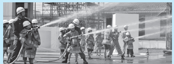
夏休み一日消防士での放水体験

時8月7日(水)9〜16時 所市消防本部・東消防署 内消防車出動訓練、放水体験、すぐに役立つ応急処置、はしご車搭乗体験など 内市内に在住の小学4〜6年生 内50人(応募者多数の場合は抽選、初めて参加する児童を優先) 内往復はがきに住所、氏名(ふりがな)、性別、学校名、学年、保護者氏名、電話番号(日中連絡の取れる番号)を記入して、7月8日(月)まで(当日消印有効)に予防課(〒362-0013上尾村537)へ