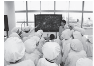
顕微鏡を使った乳酸菌の観察

「カルピス」を題材に、乳酸菌や発酵について学び、未来につながる夢を考えましょう。※プログラム内にはアレルギー物質(大豆、乳)を含む飲食がありますが、実験時に試飲を避けてプログラムに参加することも可能です。☎8月20日(火)10時30分～(90分程度) 所 コミュニティセンター 市内に在住の小学5・6年生 定 30人(応募者多数の場合は抽選) 申 往復はがき(1人1枚)に講座名、住所、氏名(ふりがな)、性別、学校名、学年、保護者の氏名、電話番号を記入して、8月2日(金)まで(必着)に消費生活センターへ