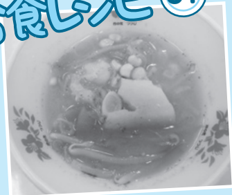
どさんこ汁 77キロロ