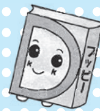
あっぴいぶっくるのキャラクター「アッピー」

子どもの読書活動支援センター 【開館時間】10:00～16:30 所 柏座4-3-8富士見小学校内 TEL・FAX 773-3711